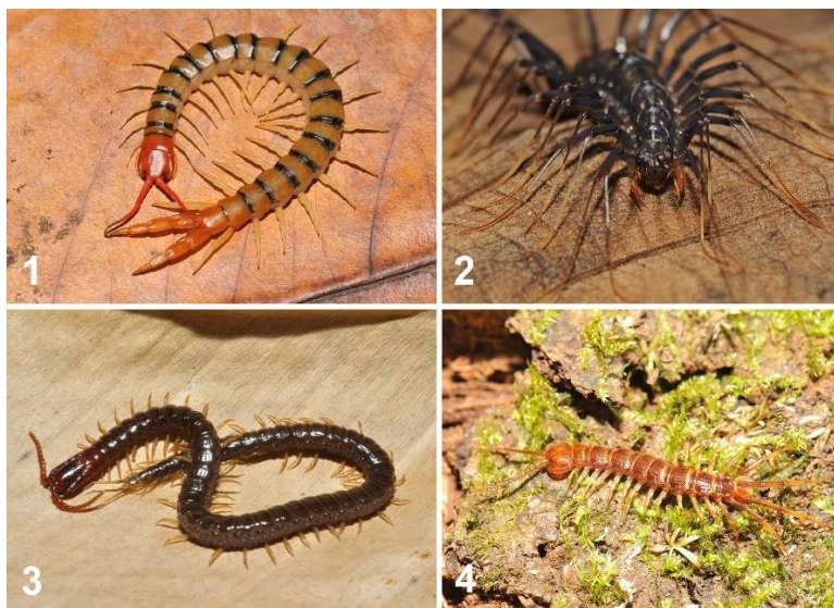
ภาพที่ ๒ ประเภทของตะขาบที่พบในประเทศไทย : ๑. ตะขาบบ้าน ๒. ตะขาบบ้านขायาว ๓. ตะขาบดิน ๔. ตะขาบหิน

ตะขาบทุกชนิดเป็นสัตว์กินเนื้อหรือกินซาก และอยู่ที่ส่วนยอดของห่วงโซ่อาหาร มักพบพฤติกรรมดำรงชีวิตในช่วงเวลากลางคืนและจะหลบซ่อนตัวเวลากลางวันในพื้นที่ที่มีความชื้นและมีแสงน้อย เช่น ใต้เศษใบไม้ ขอนไม้ หรือซอกหิน การเคลื่อนที่ของตะขาบอาศัยขาเดินแต่ละคู่ ลำตัวมีความยืดหยุ่น ทำให้ตะขาบมีความว่องไวและสามารถเปลี่ยนทิศทางได้อย่างรวดเร็ว นอกจากนี้ตะขาบขนาดใหญ่หลายชนิดยังสามารถเคลื่อนที่ได้ในน้ำ โดยการแนบขาไว้ข้างลำตัวและใช้การเคลื่อนไหวของแกนลำตัวคล้ายสัตว์เลื้อยคลานจำพวกงู จากความสามารถในการเคลื่อนที่ได้ทั้งบนบกและในน้ำ จึงเป็นปัจจัยหนึ่งซึ่งส่งผลให้ตะขาบมีขอบเขตการกระจายพันธุ์ที่กว้าง ในปัจจุบันมีเพียง ๓,๓๐๐ ชนิดเท่านั้นที่มีรายงานทั่วโลก ในประเทศไทยตะขาบแบ่งออกเป็น ๔ กลุ่ม คือ ตะขาบบ้านขायาว ตะขาบหิน ตะขาบดิน รวมถึงตะขาบที่พบได้ทั่วไปและบ่อยครั้งที่สุดคือตะขาบบ้าน ในประเทศไทยพบตะขาบบ้านแล้วทั้งสิ้น ๒๔ สปีชีส์ ที่มีความสำคัญและพบได้ทั่วไปมี ๒ สปีชีส์ คือ ตะขาบบ้านทั่วไป หรือ ตะขาบแดง Scolopendra dehaani (Brandt, 1840) และตะขาบเสื่อ Scolopendra morsitans (Linnaeus, 1758)