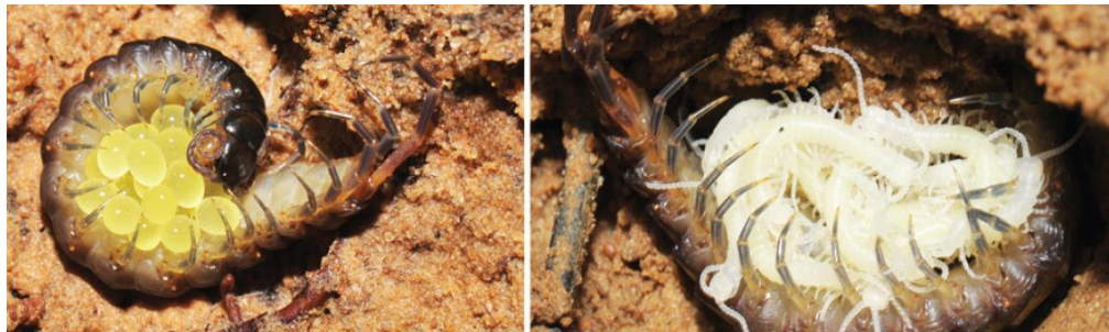
ภาพที่ ๓ การดูแลไข่ และตะขาบวัยอ่อนของตะขาบเพศเมียชนิด Otostigmus spinosus

เมียจะเก็บถุงเซลล์ดังกล่าวไว้ในช่องสืบพันธุ์บริเวณส่วนท้ายของลำตัวทำให้เกิดการปฏิสนธิ แล้ววางไข่ไว้ในรังดินหรือขอนไม้ผุประมาณ ๑๕-๗๐ ฟองต่อครั้ง ในตะขาบบางพวก เพศเมียแสดงพฤติกรรมดูแลไข่และตะขาบวัยอ่อน (parental care) โดยพันตัวโอบรอบไข่เอาไว้จากไข่จนฟักเป็นตะขาบวัยอ่อน